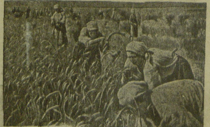
Уборка урожая в колхозе „Заможини“ (село Савинова, Корсунь-Шевченковский район, Киевской области).